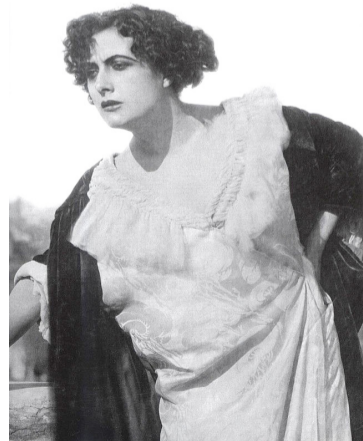
Una foto di Francesca Bertini.

Nel 1904, con il film La Dea del mare di Salvatore di Giacomo, debutta al cinema l'attrice Francesca Bertini, definita da Melania G. Mazzucco "regina incontrastata del cinema muto italiano". Toscana di nascita ma di padre napoletano, Francesca si trasferisce nel capoluogo partenopeo da piccola, imparandone la lingua, durante l'infanzia. L'attrice viene considerata come la prima diva del cinema italiano; a quell'epoca la sua fama era tale che la corris-